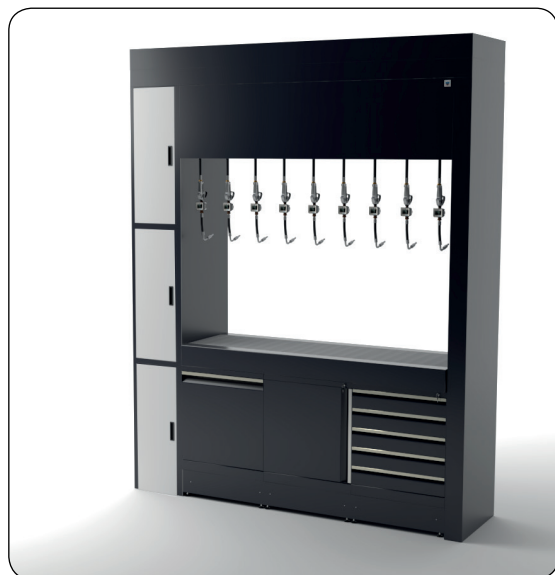
H 3270 mm W 2566 mm D 670 mm

ES Portal multiservicio para distribución energías y alojamiento de hasta 9 enrolladores fluidos, equipado con bandeja de goteo y soporte para paso de servicios. se puede integrar totalmente con mobiliario técnico y con enrolladores para la aspiración del gas de descarga modelo darwin. a petición se pueden realizar configuraciones específicas.