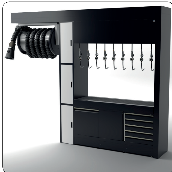
H 3270 mm W 4100 mm D 670 mm