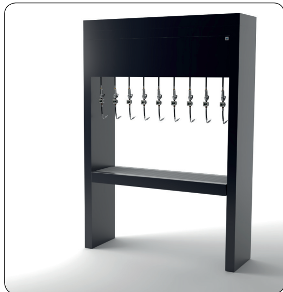
H 3270 mm W 2256 mm D 670 mm

IT Portale multi servizio per distribuzione energie ed alloggiamento fino a 9 avvolgitori fluidi, dotato di vasca raccogli-gocce e spalla per passaggio servizi. integrabile totalmente con arredo tecnico e con arrotolatori per l'aspirazione del gas di scarico modello darwin. A richiesta possibilità di configurazioni specifiche.